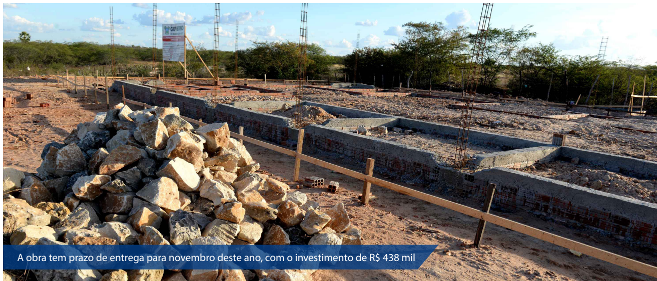
A obra tem prazo de entrega para novembro deste ano, com o investimento de R$ 438 mil

Agricultura Familiar é um meio de sobrevivência de centenas de norte-rio-grandenses. O município de Upanema, distante 280 quilômetros da capital, é um bom exemplo dessa prática no Estado. O Governo do RN está construindo um Centro de Comercialização de produtos da Agricultura Familiar. O espaço que está com as obras avançadas vai servir para que os agricultores comercializem frutas, legumes, mel, castanha, queijo, entre outros. A obra tem pra-