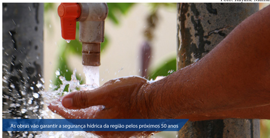
As obras vão garantir a segurança hídrica da região pelos próximos 50 anos

Para a elaboração dos estudos e o Projeto do Sistema Adutor do Seridó foi celebrado um convênio entre o Governo do Estado, através da SEMARH, e o Governo Federal, através da Agência Nacional de Águas (ANA)