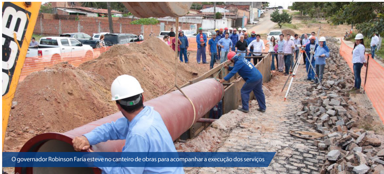
O governador Robinson Faria esteve no canteiro de obras para acompanhar a execução dos serviços

As obras de esgotamento sanitário realizadas pelo Governo do Estado, que tornarão Natal a primeira capital 100% saneada do Brasil, já chegam à marca de 74% da cidade com tubulações implantadas. Na Zona Norte, a área de maior cobertura do saneamento, já foram concluídas 77% das obras, o que representa 463,15 km de rede coletora instalada.