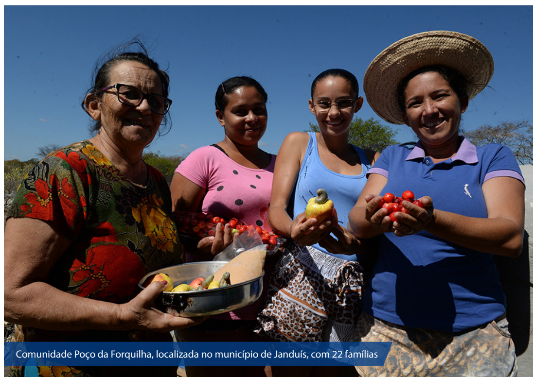
Comunidade Poço da Forquilha, localizada no município de Janduís, com 22 famílias

Na comunidade Forquilha, o Estado repassou por meio de convênio R$ 249 mil através do Projeto Governo Cidadão por meio do Acordo e Empréstimo com o Banco Mundial.